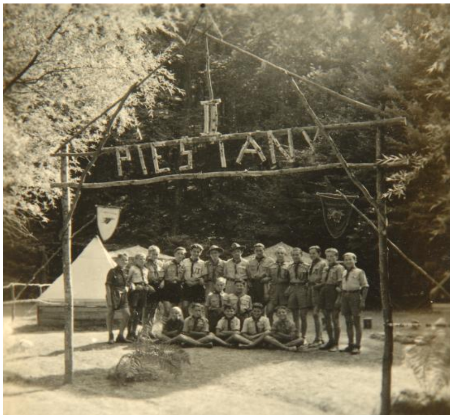
Príloha č. 5: Svetová náčelníčka dievčenského skautingu Lady Baden-Powell počas návštevy Piešťan 26. septembra 1946